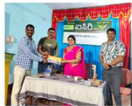
ಜನಮದಿನದ ಹಾರ್ಡಿಕ ಶುಭಾಶಯಗಳು